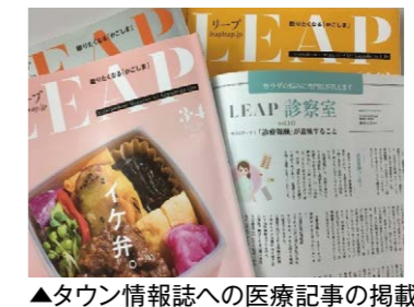
▲タウン情報誌への医療記事の掲載

◎現在は、新型コロナウイルス感染の状況を考慮して、開催の可否を判断し、感染防止対策を講じた上で、各種催しを開催しています。(写真は新型コロナウイルス感染拡大以前に開催されたもの含まれております。)