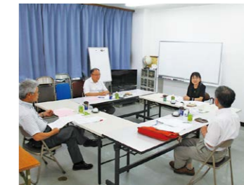
▲患者会との意見交換

診療報酬改善や、患者負担増反対など医療制度改善のための要求をあらゆる方面によびかけます。