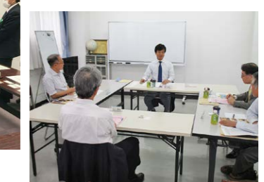
▲代議士との懇談も開催