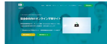
▲コロナ禍でも受講可能なeラーニング