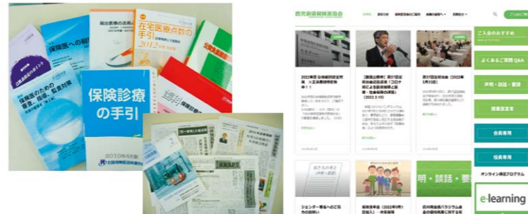
▲オリジナルの参考書籍は大好評 ▲ホームページは随時、内容更新