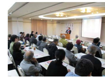
▲文化講演会や無料映画上映会など、どなたでも参加できる催しも多数開催