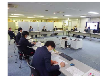
▲九州厚生局との懇談にウェブ参加