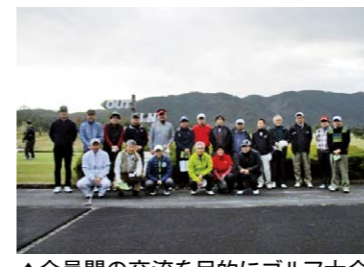
▲会員間の交流を目的にゴルフ大会