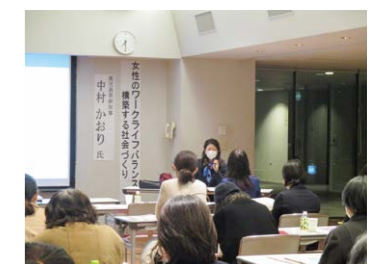
▲女性の労働環境の改善を求めて