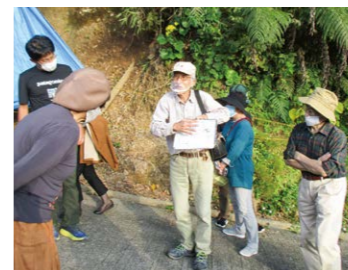
▲県内各地をめぐるバスツアーは、新たな発見もあり大好評!!