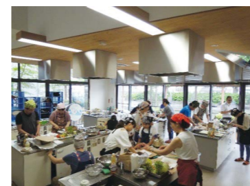
▲お子様も交じっての催しもあります