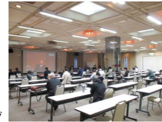
▲新点数説明会は毎回大好評(写真は2022年歯科説明会)