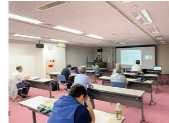
▲臨床に役立つ研究会や指導対策セミナー