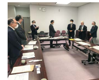
▲新型コロナへの対応を県に要請